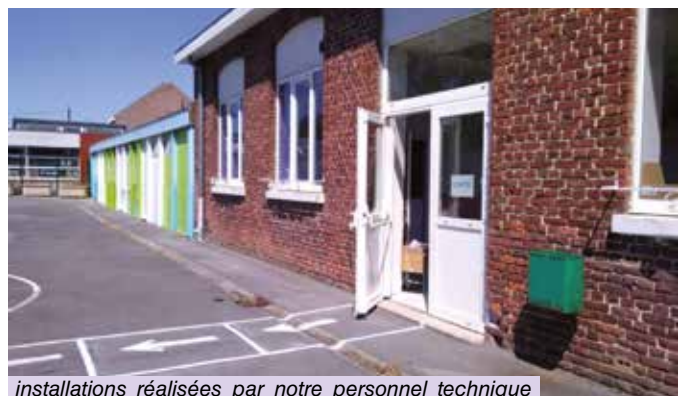
installations réalisées par notre personnel technique pour le respect des distanciations et des mesures d'hygiène à l'école Jacques Prévert

Nous leur souhaitons une belle rentrée en 6 e et une pleine réussite.