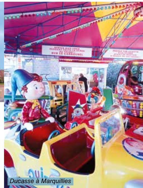
Ducasse à Marquillies